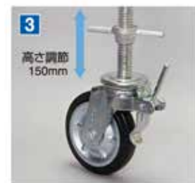
キャスター 高さ調節 150mm スチール製、ブレーキ付 (φ200mm) 仮設工業会認定品