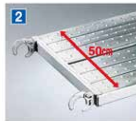
足場板 (アンチスリップ) ワンタッチではしご枠にひっかけられるフック(メッキ仕上げ)滑り止め加工を施しています。 仮設工業会認定品