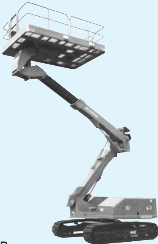
HFZ090D 当社のレンタル機は白ゴムパット仕様です。