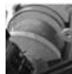
● 乱巻防止機能付きウィンチ