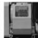
● 巻き込み防止ウインチガード