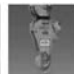
● 走行時フック揺れ防止機能