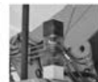
● 過負荷外部表示灯